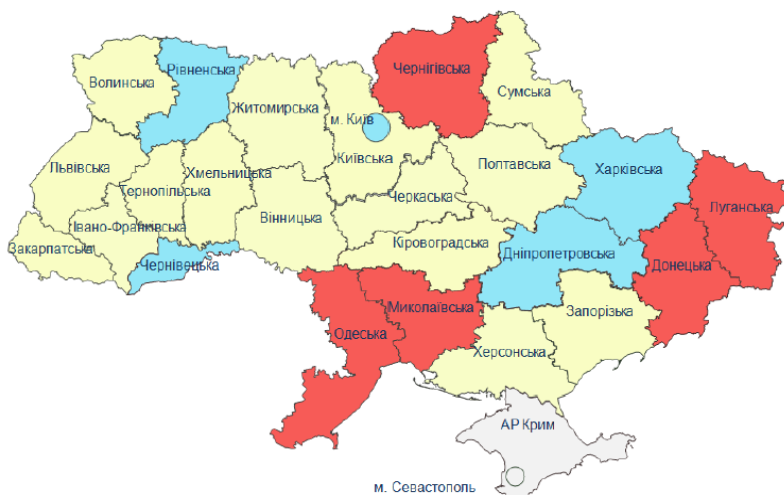
Рис. 2. Результати моніторингу соціально-економічного розвитку регіонів за 2017 рік [10]

За даними моніторингу соціально-економічного розвитку областей за 2017 рік, Харківщина втретє посіла перше місце серед інших областей України та друге – після Києва. Загальну рейтингову оцінку регіонів розраховано за 64 показниками, що згруповані за 12 напрямками. За половиною напрямків та 22 показниками Харківська область входить до п'ятірки лідерів [9].