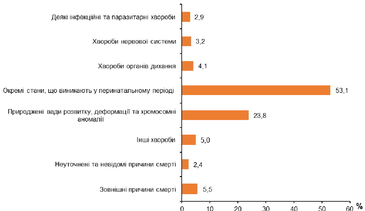
Рис. 1. Структура причин смерті дітей у віці до 1 року у 2016 р.

Аналогічно аналізу смертності дітей у віці до 1 року проводиться аналіз смертності дітей у віці до 5 років. «Показники смертності (тривалості життя, ймовірність дожиття) також є інтегрованою характеристикою умов, у яких проходить життя та розвиток людини. Вони акумулюють у собі вплив стану медичного та соціального благополуччя у країні, умов праці, екологічної ситуації тощо». Оновлений варіант Національної методики оцінки людського розвитку в розділі «Відтворення населення» враховує саме показник смертності дітей у віці до 5 років, який «Характеризує рівень дитячої смертності та вимірюється ймовірністю померти до досягнення 5 років, є загальновизнаним і доволі чутливим показником впливів медико-демографічного й соціального благополуччя в країні».