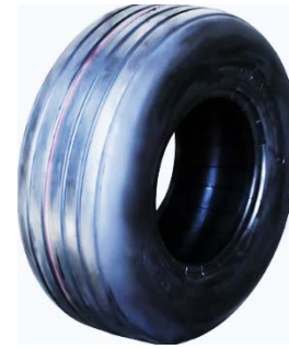
Рис. 4. Ребристий протектор

Вузлуватий або багато-блоковий протектор (рис. 5) можна встановити, як на провідні колеса, так і на відомі колеса сільськогосподарської техніки. Такі покришки є кращим вибором для м'яких типів ґрунтів тому, що вони завдають мінімальної шкоди ґрунту. Вони мають меншу несучу здатність ніж колеса з ребристим протектором.