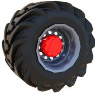
Рис. 7. Протектор «Ключка»

Шини високого тиску наразі не використовуються у сільськогосподарському виробництві.