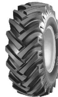
Рис. 6. Спрямований протектор «ялинка»

Спрямований протектор «ялинка» (рис. 6) встановлюється на ведучі колеса, як правило на ведучі колеса тракторів та розприскувачів, причепів сільськогосподарської техніки і забезпечує високу прохідність на різних ґрунтах й погодних умовах.