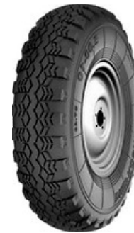
Рис. 5 Багато-блоковий протектор

Спрямований протектор «ялинка» (рис. 6) встановлюється на ведучі колеса, як правило на ведучі колеса тракторів та розприскувачів, причепів сільськогосподарської техніки і забезпечує високу прохідність на різних ґрунтах й погодних умовах.