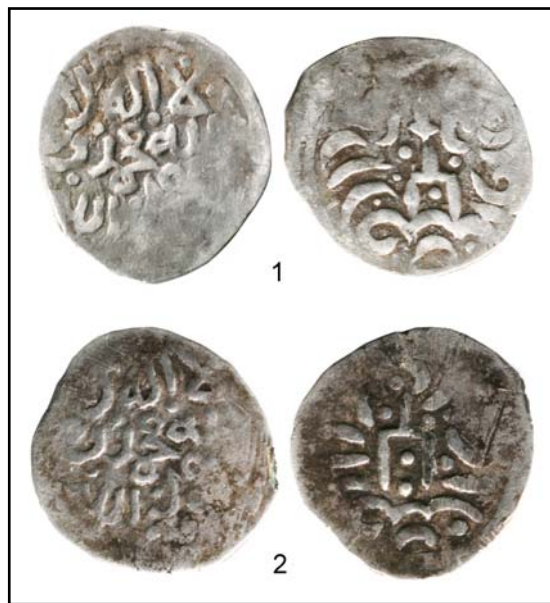
Рис. 20. Данги с обозначением места выпуска Орду-Базар и мусульманским символом веры. 1 — 0,72 г; 2 — 0,65 г.

87). В начале сетки находится штемпельная пара с лицевым штемпелем, на котором вырезаны имя и титулы хана Тимур-Кутлуга, затем используются штемпели лицевиков с текстом калимы, затем монеты бьются с искаженными (некоторые — до нечитаемости) легендами на оборотных сторонах. Можно утверждать, что в данном случае смена «именного» начального типа на анонимный, с суннитским символом веры, была произведена сознательно и связана с периодом interregnum после смерти хана. И лишь затем, как отмечено в статье, спешное выполнение монетным двором заказа и отсутствие квалифицированного резчика привели к выпуску типов с искаженными легендами и утрате некоторых принципов организации работы монетного двора (Зайончковский и др. 2013: 88).