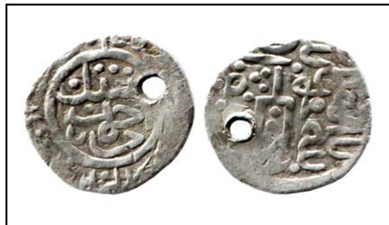
Рис. 12. Данг хана Саид-Ахмада II с калимой и тамгой на реверсе, 0,64 г.

Fig. 10. Dang of Timur khan with Kalima and date on reverse, 0.95 g.