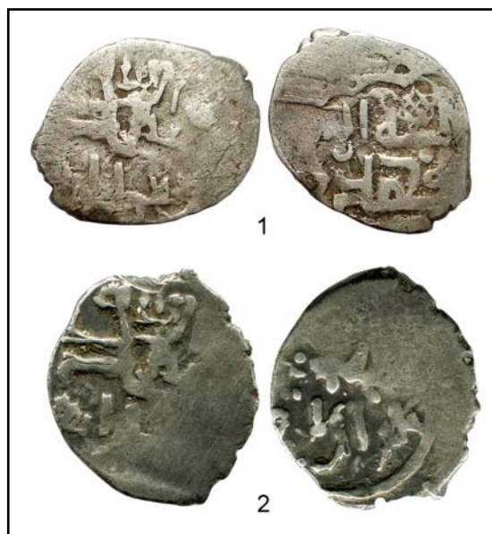
Рис. 4. Азакские данги начала XV века.

На рис. 4: 1 воспроизведена монета, отчеканенная двумя штемпелями с текстом калимы. Она уже была опубликована (как и данг на рис. 4: 2) Ю.В. Зайончковским с ремаркой: складывается впечатление, что для её изготовления просто использовали имеющиеся под