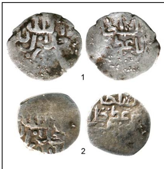
Рис. 2. Азакские данги хана Джалал ад-Дина, отчеканенные разными лицевыми штемпелями.

Касаюсь историографии темы, нужно сказать, что Ю. В. Зайончковским в последние годы были изданы несколько статей (в т. ч. в соавторстве), посвященные мулам позднеджучидских дангов — монет с нестандартным формуляром (Зайончковский 2014). Мулы (другое именование — «гибридные монеты») — это монеты, отчеканенные штемпелями разных монетных типов. Была предложена «производственная» версия объяснения их существования: на монетном дворе для чеканки монет использовались все имеющиеся в наличии штемпели вне зависимости от вырезанных на них легенд. Как вариант объяснения такой практики можно использовать предположение о необходимости в сжатые сроки выполнить объемный заказ по чеканке дангов при условии недостатка «официально утвержденных» пар штемпелей (Зайончковский 2015: 99). Было показано, что золотоордынские монетчики в случае необходимости использовали и штемпели медных пулов для чеканки серебра (Зайончковский, Леонов 2016).