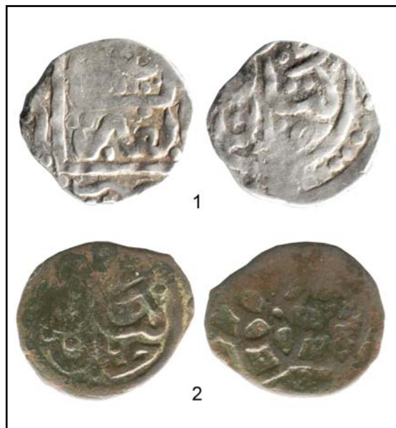
Рис. 7. Данг и именной пул хана Кибака.

Авторы, как было сказано выше, склоняются ныне не к «политической», а к «производственной» версии объяснения причин изготовления подобных мулов. Нужно также констатировать, что каждая конкретная эмиссия, упомянутая в данной статье, требует отдельного тщательного исследования, которое, как надеемся, будет проведено в будущем при на-