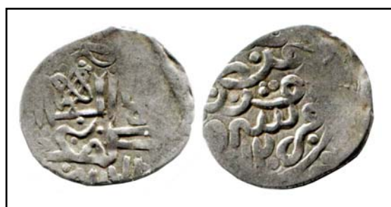
Рис 19. Данг 812 г.х. с обозначением места выпуска Орду и мусульманским символом веры, 1,01 г.