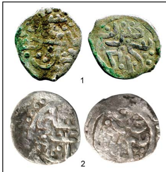
Рис. 22. Анонимные данги с титулами хана на аверсе и обозначением места выпуска Сарай на реверсе.

Fig. 21. Anonymous dang with title "The Just Sultan" on the obverse and with indication of mint place as Saray on the reverse, 0.95 g.