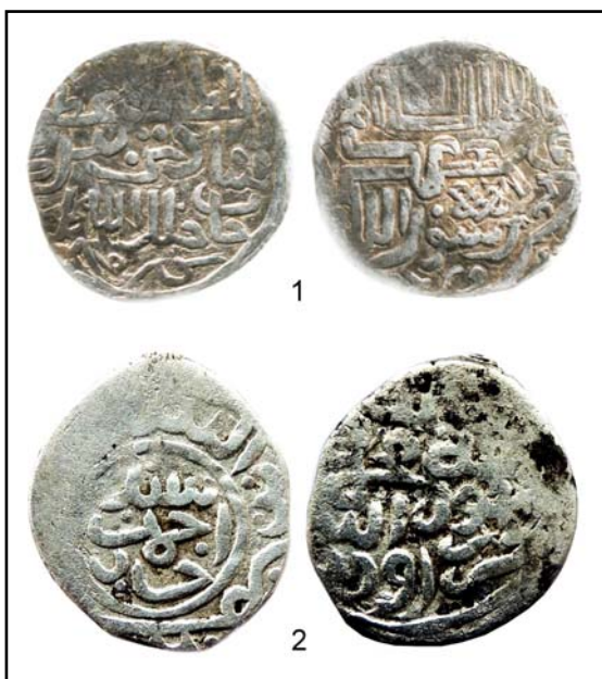
Рис. 11. Данги ханов Шадибека (1) и Саид-Ахмада II (2) с текстом калимы и обозначением места чеканки — Орду — на оборотных сторонах.

Fig. 12. Dang of Sayyid Ahmad II khan with Kalima and tamga on the reverse, 0.64 g.