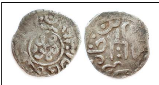
Рис. 1. Данг хана Мухаммада б. Тимура, Хаджи-Тархан, 831 г.х., 0,62 г.

Fig. 1. Dang of Muhammad b. Timur, Hajji Tarkhan, 831 AH, 0.62 g.