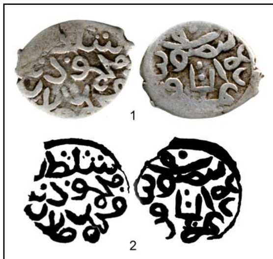
Рис 15. Данг и прорисовка оттисков его штемпелей с именем Тин-Суфи б. Мансура на реверсе.