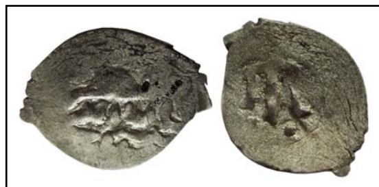
Рис 16. Данг хана Гияс ад-Дина с изображением лировидной тамги, 0,57 г.

В Поволжье в середине первой половины XV века от имени ханов Мухаммада и Гияс ад-Дина выпускались монеты с изображением лировидной тамги на реверсе (Мухаммадиев 1983: 130), без какой-либо легенды (рис. 16). Отсутствие надписи на оборотной стороне, возможно, объясняется чисто техни-