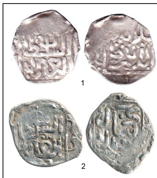
Рис. 13. Данги ханов Джалал ад-Дина (1) и Кибака (2) без обозначения места выпуска и указания года чеканки.

Fig. 11. Dangs of Shadi Beg (1) and Sayyid Ahmad II khan (2) with Kalima and indication of the mint as Ordu on reverses.