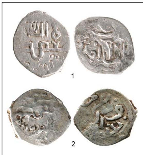
Рис 18. Азакские данги начала XV века с мусульманским символом веры и обозначением места выпуска.