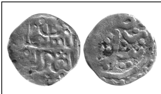
Рис. 21. Анонимный данг с титулами «султан справедливый» на аверсе и обозначением места выпуска Сарай на реверсе, 0,95 г.

Fig. 21. Anonymous dang with title "The Just Sultan" on the obverse and with indication of mint place as Saray on the reverse, 0.95 g.