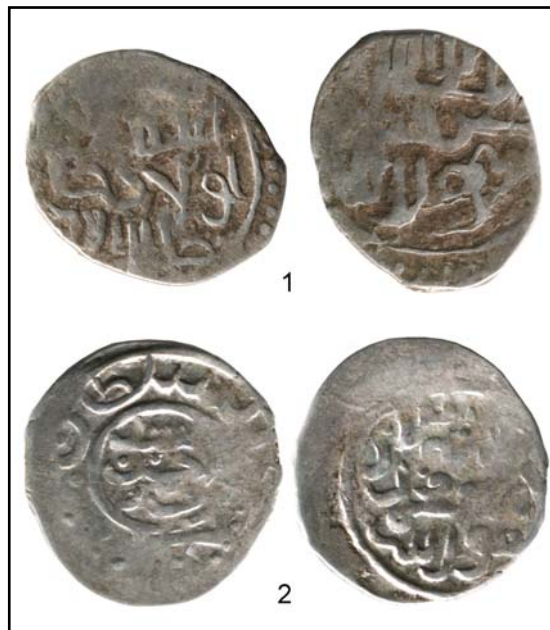
Рис. 9. Ханско-мусульманские данги ханов Пулада и Саид-Ахмада II.

Разницу между мулами, именными монетами с нестандартным формуляром и анонимными дангами авторы видят в причинах, приведших к изготовлению монет с нестандарт-