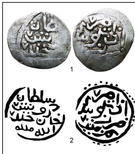
Рис 14. Крымский данг с именем Идегея на реверсе и прорисовка оттисков штемпелей этого данга.

Однако, несмотря на столь большой объем власти, Идегей воздержался от помещения на оборотной стороне монет исключи-