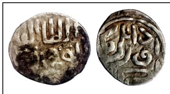
Рис. 8. Мул времен Токтамыша, отчеканенный штемпелями для изготовления дангов и пулов, 1,34 г.

Fig. 7. Dang and personalized pul of Kebek khan.