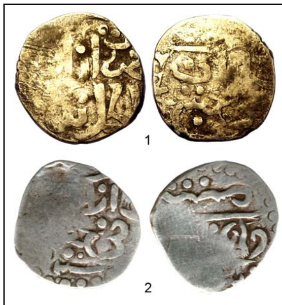
Рис. 5. «Двухреверсные» азакиские данги, входящие в штемпельную сетку с именными монетами Шадибека.

Fig. 5. Azaq's dangs, coined with different reverse stamps, from stamp grid including personalized silver coins of Shadi Beg khan.