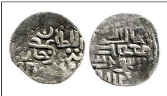
Рис. 10. Данг хана Тимура с калимой и датой на реверсе, 0,95 г.

Fig. 10. Dang of Timur khan with Kalima and date on reverse, 0.95 g.