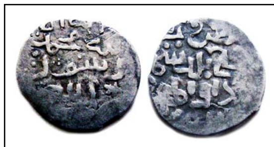
Рис 17. Азакский данг 802 г.х. с мусульманским символом веры и обозначением места выпуска, 1,02 г.