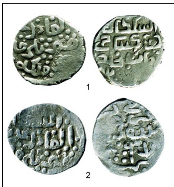
Рис. 3. Данг, отчеканенный лицевыми штемпелями с именами и титулами ханов Тимур-Кутлуга и Шадибека (1), и крымский данг Тимур-Кутлуга (2).

Fig. 3. Dang, coined with obverse stamps with titles and names of Timur Qutlugh and Shadi Beg (1), and Krym's dang of Timur Qutlugh (2).