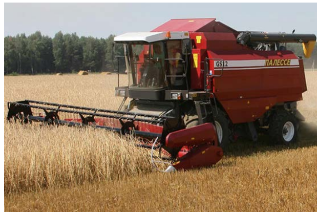
Рис.2. Комбайн зернозбиральний ПАЛЕССЕ GS 12 в роботі

6.Коефіцієнт робочих ходів відповідно по варіантах а,б,в : \phi = 0,985 ; \phi = 0,992 ; \phi = 0,994 .