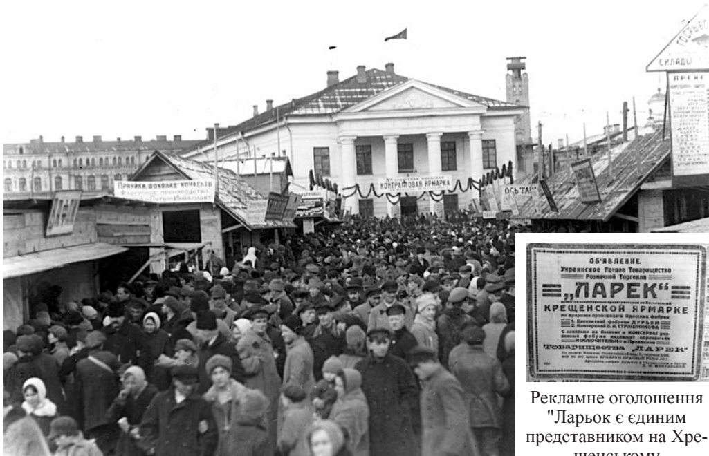
Контрактний ярмарок у Києві, 1925 р.

Рекламне оголошення "Ларьок є єдиним представником на Хре- щенському ярмарку...", 1923 р.