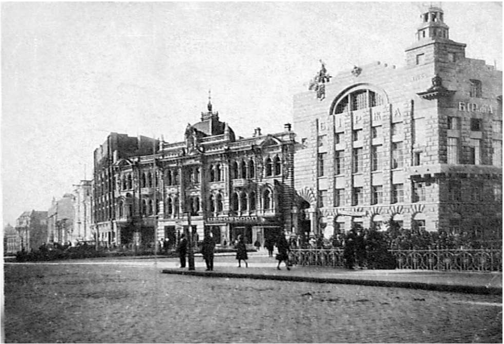
Харківська товарна біржа. Архітектор – В. А. Лінецький, 1925 р.