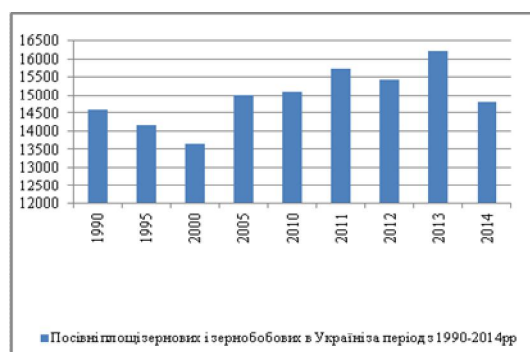
Рис. 1. Посівні площі зернових і зернобобових культур