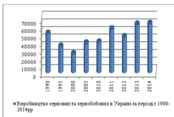
Рис. 2. Виробництво зернових та зернобобових культур

Урожайність зернових та зернобобових 1990 року до 2010 року зменшувалась, з 35 ц/га до 29 ц/га і лише з 2011 року почала стрімко підвищуватись і на 2014 рік становила 44 ц/га. Додержання елементів технології вирощування, основними з яких є живлення рослин та їх захист від шкідників, хвороб та бур'янів, разом із ґрунтово-кліматичними умовами нашої країни забезпечили підвищення урожайності зернових та зернобобових (табл. 3).