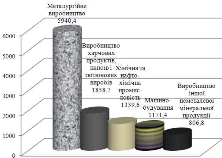
Рисунок 1 – Обсяг залучення іноземних інвестицій у 2010 р. у галузі переробної промисловості України, млн доларів США

інвестицій; на підприємствах торгівлі, ремонту автомобілів, побутових виробів та предметів особистого вжитку – 4764,5 млн доларів США або 10,7% прямих інвестицій; в організаціях, що здійснюють операції з нерухомим майном, оренди, інжинірингу та надання послуг підприємцям – 4754,1 млн доларів США або 10,6% прямих інвестицій (рис. 1) [2]. Галузі, в яких обсяг іноземного інвестування у 2010 р. зріс порівняно з попереднім періодом, зображено на рисунку 2.