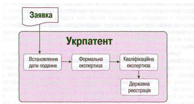
Рисунок 3.1 – схема проходження заявки на реєстрацію торговельної марки в Укрпатенті

Підприємства (або приватні підприємці, або фізичні особи) можуть отримати виключне право на території України на позначення (словесне, зображувальне, комбіноване) лише шляхом його реєстрації як торговельної марки відповідно до Закону України „Про охорону прав на знаки для товарів і послуг”. Заявка на реєстрацію торговельної марки подається до Державного підприємства "Український інститут промислової власності (Укрпатент)". Спрощену схему проходження заявки показано на рис. 3.1.