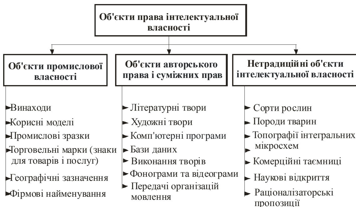
Рисунок 1.1 – Структура об'єктів інтелектуальної власності в Україні

Право на наукове відкриття засвідчується дипломом та охороняється у порядку, встановленому законом, (ст. 457 ЦК). Структуру об'єктів інтелектуальної власності в Україні наведено на рис. 1.1.