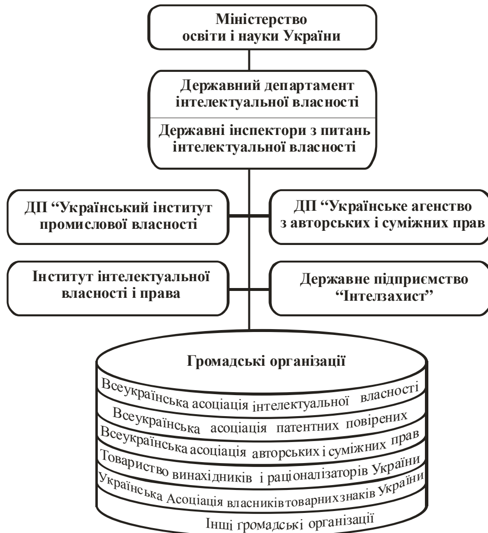
Рисунок 1.2 – структура державної системи правової охорони інтелектуальної власності

інтелектуальної власності, взаємодіє з громадськими організаціями, які опікуються інтелектуальною власністю.