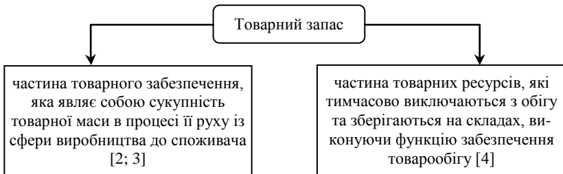
Рисунок 2 – Зміст товарних запасів торговельного підприємства

Сутність товарних запасів визначається через положення (рис. 2).