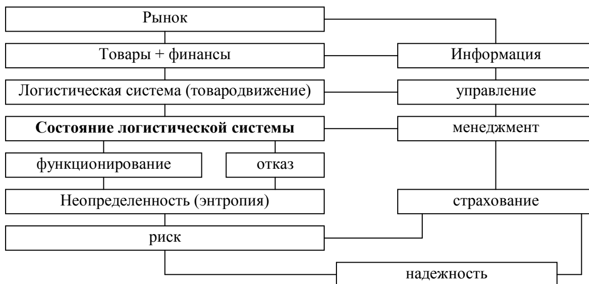
Рис. 1. – Схема взаимосвязи управления и страхования в логистических системах [2, с. 176])

В общем виде состояние логистической системы с позиции диагностики представлено в работе [2, с. 176] – рис.1.