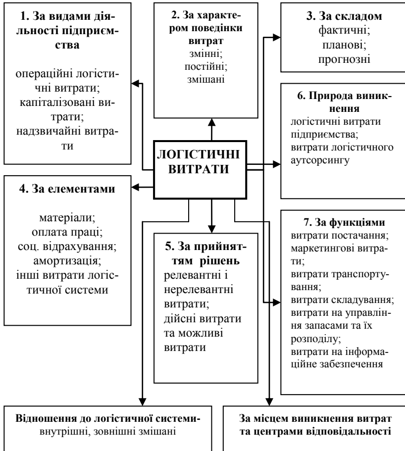
Рисунок 1 – Класифікація логістичних витрат для цілей управлінського обліку підприємств торгівлі

ку за допомогою субрахунків до рахунка 92 «Адміністративні витрати»: 921 «Логістичні витрати на інформаційне забезпечення», 922 «Виплати логістам». Кризові явища в економіці України значно погіршили фінансово-економічний стан багатьох торговельних підприємств, що посилює актуальність розробки заходів зі скорочення собівартості.