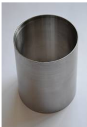
Рисунок 4 - Внешний вид ЗВ уплотнения после упрочнения методом карбонитрации и очистки.

Второй способ впервые был применен во время остановочного ремонта в марте 2014 года на ПАО «АЗОТ» г. Черкассы, при ремонте ротора КНД компрессора поз. 103J. Он состоял в том, что после посадки на вал и шлифовки втулок, подверженных ИА, проводили их поверхностное упрочнение методом ЦЭЭЛ с последующей обработкой методом БУФО (рисунок 5 и 6).