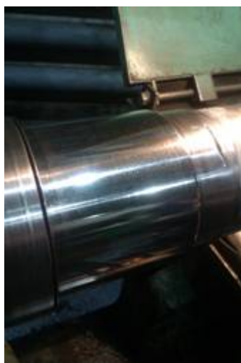
Рисунок 6 - Внешний вид втулки после обработки БУФО.

Ремонт был выполнен в сжатые сроки в течении 24 часов. При этом параметры работы уплотнения не изменились.