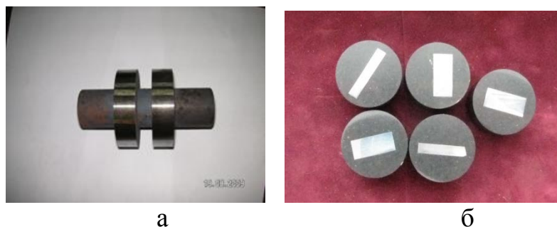
Рисунок 1 – Образец для ИА и ЦЭЭЛ (а); шлифы образцов (б).

Методика исследований. Для ИА и ЦЭЭЛ использовали специальные образцы из стали 40Х, термообработанные, как и в [3], на твердость 3900-4000 МПа, а также на твердость 3000-3100 МПа. Образцы изготавливали в виде катушки, состоящей из двух дисков, диаметром 50 мм и шириной 10 мм, соединенных между собой проставкой диаметром 15 мм и имеющей два технологических участка такого же диаметра (рис. 1,а). Поверхности дисков шлифовали до Ra = 0,5 мкм. Из упрочненных образцов вырезали сегменты, из которых изготавливали шлифы (рис. 1, б).