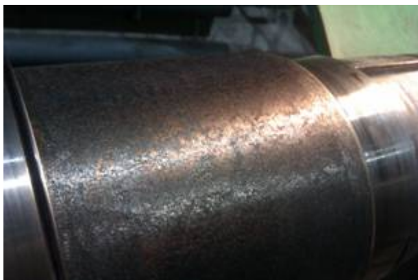
Рисунок 5 - Внешний вид втулки после ЦЭЭЛ.