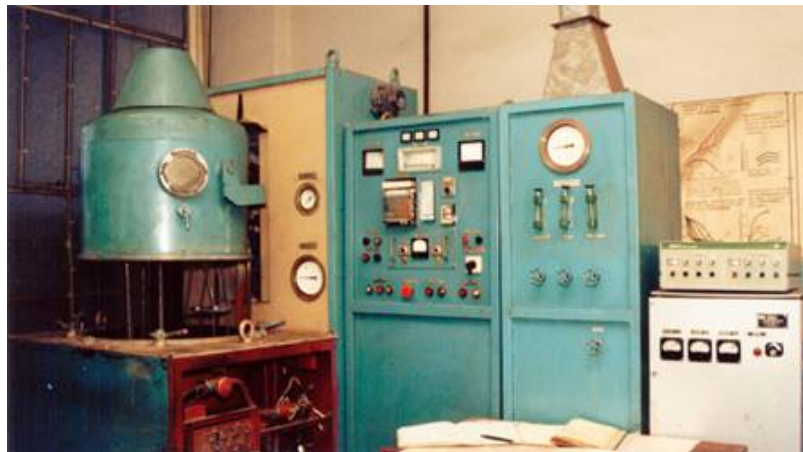
Рисунок 2 - Установка ИА модели «НГВ - 6,6/6 - И1».

Процесс ЦЭЭЛ производился в автоматическом режиме с помощью установки модели «ЭИЛ – 8А». Поэтапная ЦЭЭЛ образцов проводилась путем легирования графитовым электродом марки ЭГ-4 (ОСТ 229-83) с энергией разряда 0,42 Дж (1-й этап) и 0,1 Дж (2-й этап) с производительностью, соответственно 2 и 5 мин/см 2 . Ионное азотирование образцов проводили при температуре 520 °С в течение 12 ч на установке НГВ-6,6/6-И1 (рис. 2). Упрочнение образцов проводили в различной последовательности: ИА; ЦЭЭЛ; ЦЭЭЛ+ИА; ИА+ЦЭЭЛ. С целью снижения шероховатости поверхности после ЦЭЭЛ применяли БУФО.