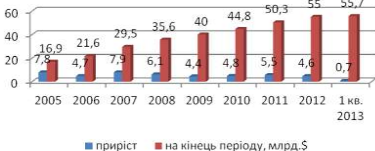
Рис. 1. Обсяг прямих іноземних інвестицій (млрд доларів США)[3]

Обсяг вкладених із початку інвестування в економіку України прямих іноземних інвестицій (акціонерного капіталу) на 1 квітня 2013 р. становив 55708,9 млн доларів США, що на 1,3 відсотка більше обсягів інвестицій на початок 2013 р., та в розрахунку на одну особу населення складає 1226,7 доларів США (рис. 1).