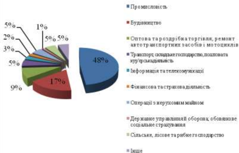
Рис. 3. Розподіл освоенних капітальних інвестицій за сферами економічної діяльності (у % до загального обсягу) [3]