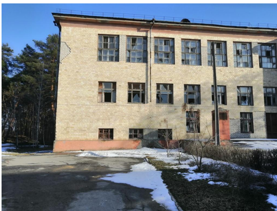
Фото 3. Вибиті шибки у приміщенні клубу ДБТУ. 25.02.2022

У підвалі гуртожитку № 1, куди ми, пригинаючись від ракет, що летіли над нами в бік Харкова, прийшли, вже були люди – викладачі, студенти, місцеві мешканці нашого студмістечка. Напівтемрява у підвалі ще більше пригнічувала тривожний стан людей. Ми із студентами-іноземцями поповнили ряди мешканців підвалу. В перші години був ступор і не розуміння ситуації. Студенти-іноземці виглядали стомленими від постійної зміни своєї дислокації, дещо зляканими та безпорадними, хоча дивлячись на них, здавалося, що вони до кінця не розуміють, що відбувається і, що це