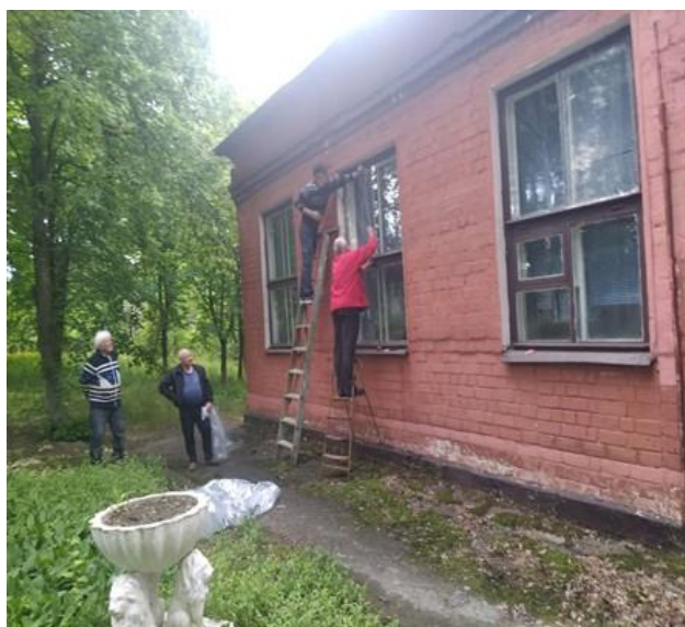
Епізоотологічний корпус ФВМ ДБТУ після ракетного обстрілу. Травень 2022