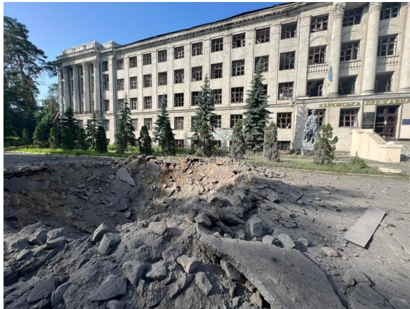
Фото 14. Вирва, на вулиці Академічній, напроти головного навчального корпусу Інституту ветеринарної медицини ДБТУ від ракетного обстрілу 19.06.2022

Несправедлива і жорстока війна, яка прийшла на нашу мирну і дружелюбну Україну неймовірним лихом, пожирає все живе і не живе, навіть каміння і метал, а люди продовжують жити своїм не простим і нелегким життям: плачуть і сміються, люблять і ненавидять, народжуються і помирають, одні їдуть в евакуацію у відносно спокійні регіони, інші повертаються з неї у свої обжиті домівки. Нічого не зупиняється у цьому життєвому колообігу, розпочатому невідомо коли і ким, проте точно відомо – для життя !!!