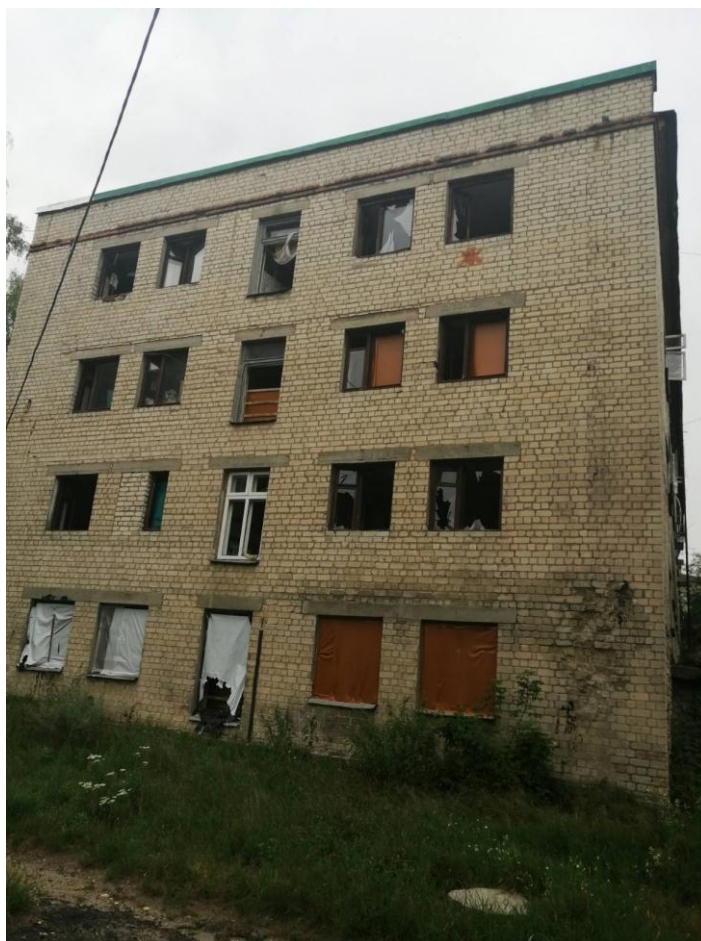
Гуртожиток № 3 ІВМ ДБТУ після ракетного обстрілу. Липень 2022