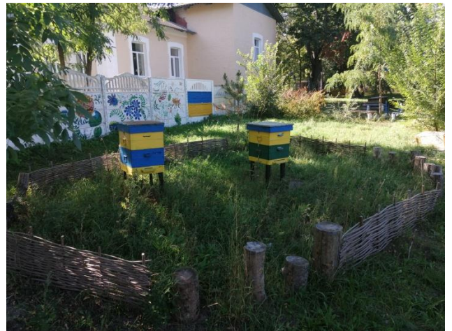
Фото 12. Зона відпочинку «Білий лебідь» на території академмістечка ДБТУ. Червень 2022 р.