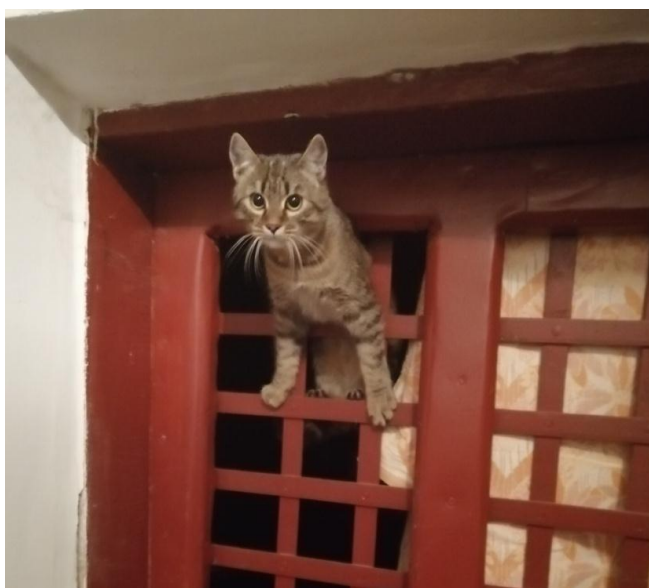
Фото 5. Кіт за прізвиськом «Макс», який жив з нами у підвалі.