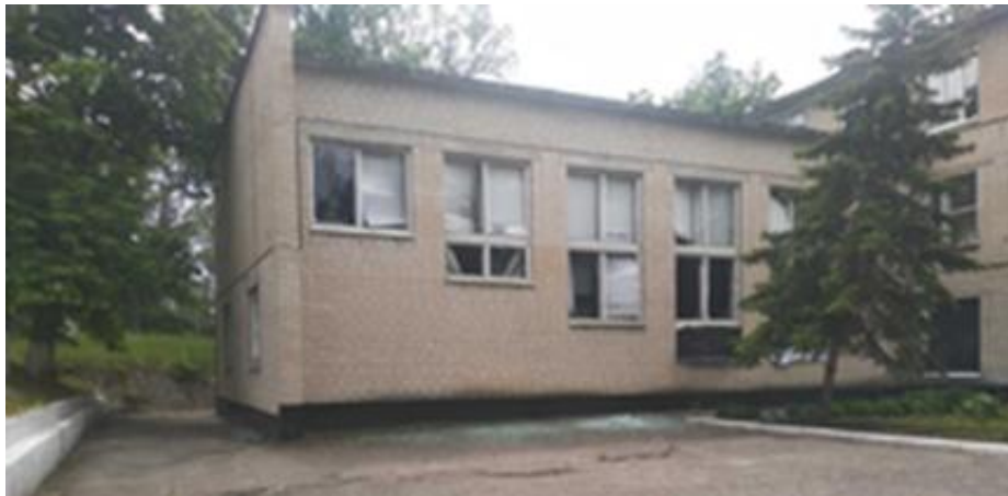
Морфологічний корпус ФВМ ДБТУ після ракетного обстрілу. Травень 2022