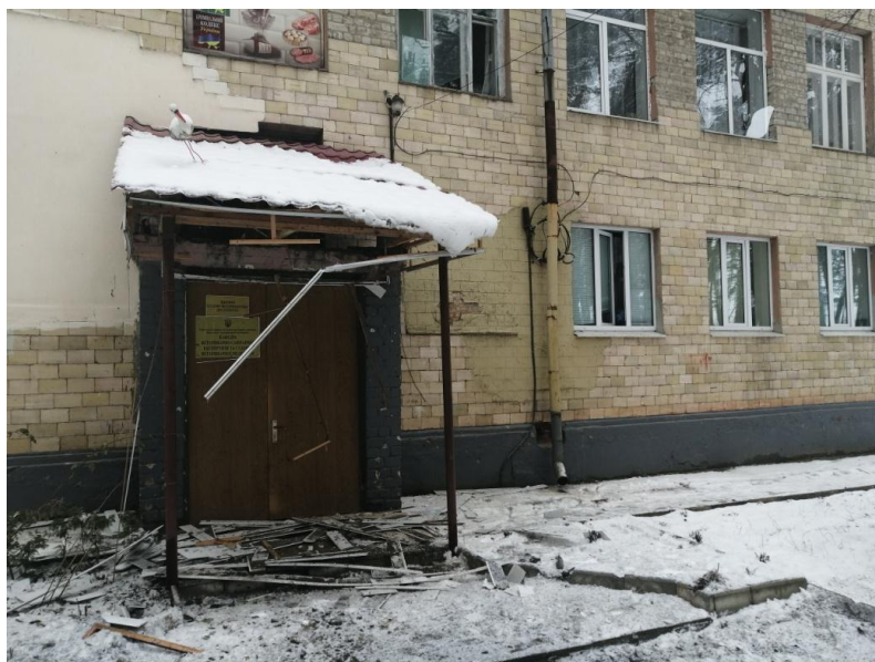
Фото 2. Зовнішній вигляд кафедри ветеринарно-санітарної експертизи та судової ветеринарної медицини (нині кафедра називається – санітарії, гігієни та судової ветеринарної медицини). 25.02.2022