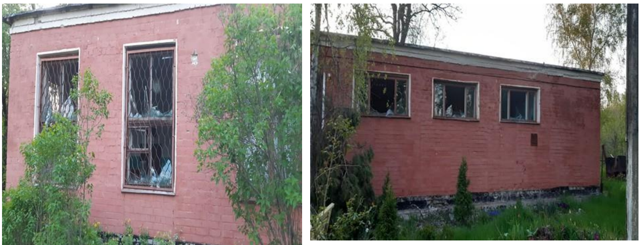
Паразитологічний корпус ФВМ ДБТУ після ракетного обстрілу. Травень 2022