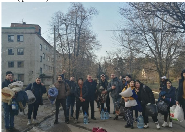
Фото 1. Прямуємо на кафедру ветеринарно-санітарної експертизи та судової ветеринарної медицини ДБТУ із студентами-іноземцями. 24.02.2022

В таких думках час плинув повільно. О 15 годині студенти-іноземці третього гуртожитку запитали, що їм робити, де схоронитися, що буде далі. Відповіді не було, адже до цього такого не було, ніколи не приходилося ховатися у сховищах. Проте тут же згадався підвал під кафедрою ветеринарно-санітарної експертизи та судової ветеринарної медицини (нинішня назва кафедри – санітарії, гігієни та судової ветеринарної медицини). І ось ми разом вирушили на кафедру, щоб там у безпеці провести ніч, що передувала (фото 1).