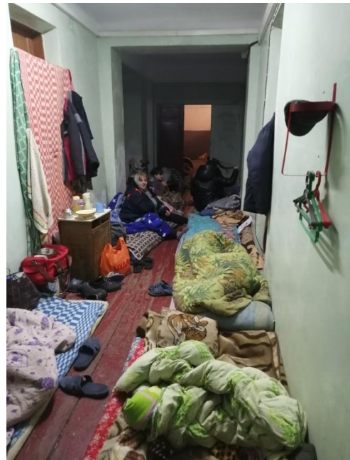
Фото 7. Загальний вигляд у сховищі