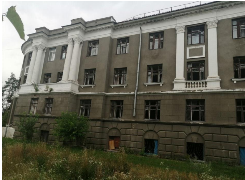
Гуртожиток № 1 Інституту ветеринарної медицини (ІВМ) ДБТУ після ракетного обстрілу. Липень 2022