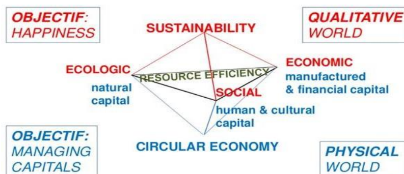
Fig 1. Situating society, sustainable development and a Circular Industrial Economy

Chapter 2 of the book „Designing for the Circular Economy” describes the concept of the circular industrial economy stating that in fact sustainable development and the circular industrial economy are the two sides of a coin, the first representing a „qualitative” world with happiness as an objective, the second a material world with the objective of decoupling the creation of wealth from the consumption of resources, referring here to the efficient use of resources and their capitalization. (Charter, 2019)