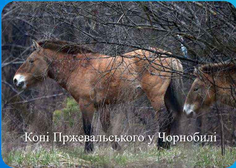
Коні Пржевальського у Чорнобилі

Екокоридори – це фактично шляхи життя. Бойові дії могли частково або повністю порушити їх, а тварини могли «відступити» налякані запахами та звуками війни. Тепер їм треба призвичаюватися до нових умов.