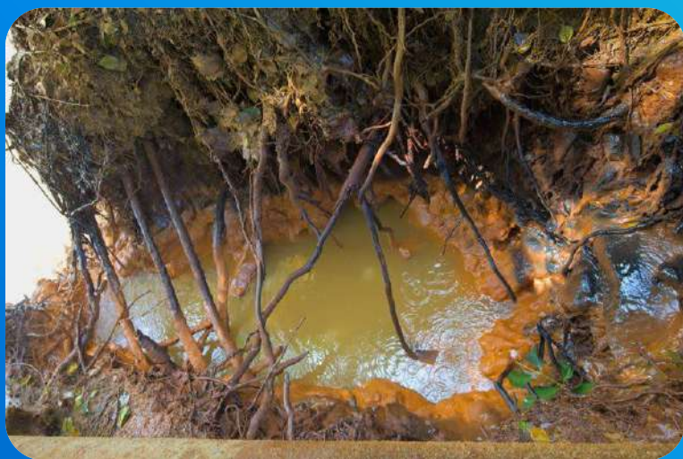
Так виглядає «шахтна вода» на поверхні землі

Тепер через інтенсивні обстріли не вдається відкачувати воду й у шахтах по інший бік фронту. Внаслідок пошкодження енергетичних систем не працюють насоси у трьох шахтах Луганської області. На одній із них у Золотому був повністю затоплений один рівень.