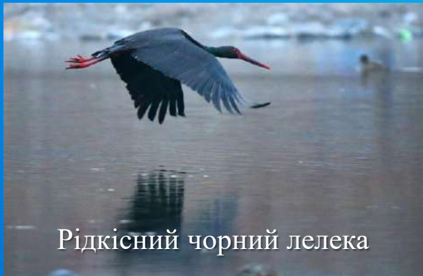
Рідкісний чорний лелека

Рідкісним видам тварин загрожує не так загибель деяких особин, як руйнування або зміна їхніх ареалів та міграційних коридорів, пояснюють дослідники.