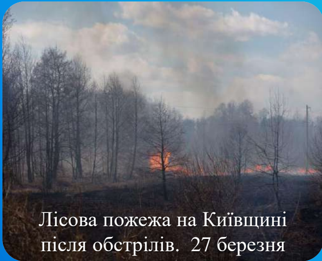
Лісова пожежа на Київщині після обстрілів. 27 березня

Окрім радіоактивної небезпеки, обстріли та окупація підвищують ризик викидів токсичних відходів з промислових підприємств України. Найбільша їхня кількість розташована на сході країни, де йдуть активні бойові дії.