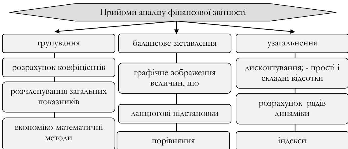
Рис. 2. Прийоми аналізу фінансової звітності

Аналіз фінансової звітності проводиться із застосуванням різноманітних спеціальних прийомів (рис. 2).