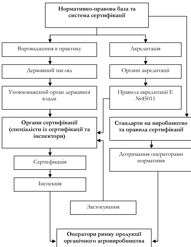
Рис. 2. Схема формування нормативно-правової бази та системи сертифікації в органічному агровиробництві країн ЄС