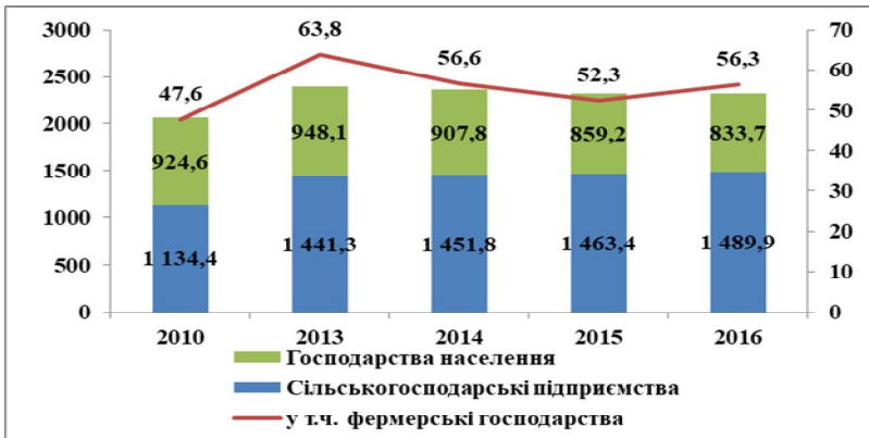
Рис. 3. Виробництво м'яса в господарствах усіх категорій України, тис. тонн

Одночасно звертає увагу високе значення показника імпортозалежності України (39 %) по такій групі товарів, як олія рослинна. Цей факт пояснюється ввезенням тропічних олій, які не виробляються в Україні (пальмова, кокосова тощо). Таке високе значення дає підстави для припущення щодо зловживання використанням олій рослинного походження замість тваринного при виробництві продовольчих товарів вітчизняними підприємствами.