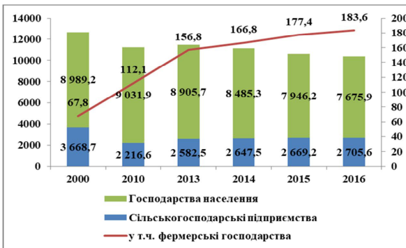
Рис. 2. Виробництво молока в господарствах усіх категорій України, тис. тонн

В Україні таких господарства населення понад 4 млн., якіснє мають державної реєстрації як юридичні особи або фізичні особи-підприємці, є дрібними, соціально незахищеними, не мають доступу до державної підтримки, в яких відсутні фінансові можливості здійснювати автоматизоване виробництво продукції сільського господарства, які також не мають можливості вийти на організований ринок та реалізувати свою продукцію споживачам в цивілізований спосіб.