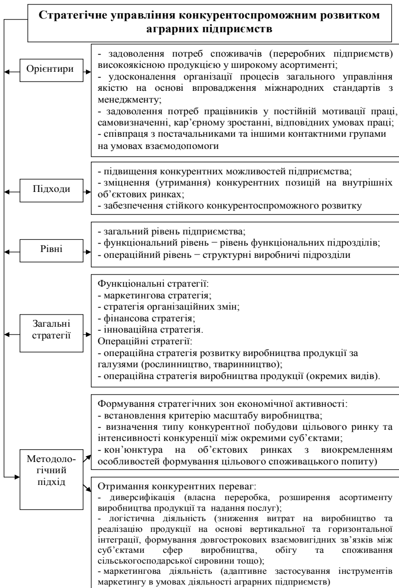
Рис. 1. Інтегрований методологічний підхід до теорії конкурентоспроможного розвитку суб'єктів агробізнесу