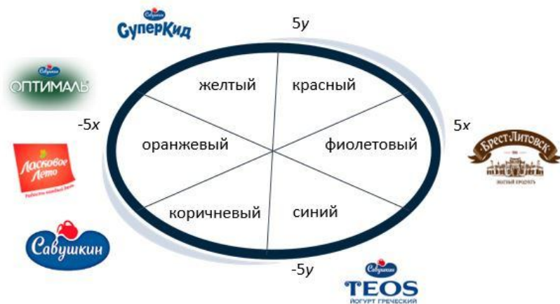
Рис. 4. Модель эмоционального восприятия бренда ОАО «Савушкин продукт»

«Ласковое лето» – это семейный бренд, который несет радость своим потребителям каждый день. Коммуникация простая и понятная. Его можно отнести к оранжевому сегменту.