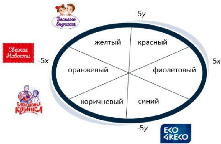
Рис. 5. Модель эмоционального восприятия бренда ОАО «Бабушкина крынка»

«Свежие новости» – бренд качественных и свежих традиционных молочных продуктов. Направлен на семейное потребление. В коммуникации делается упор на свежесть молока и всей продукции бренда.