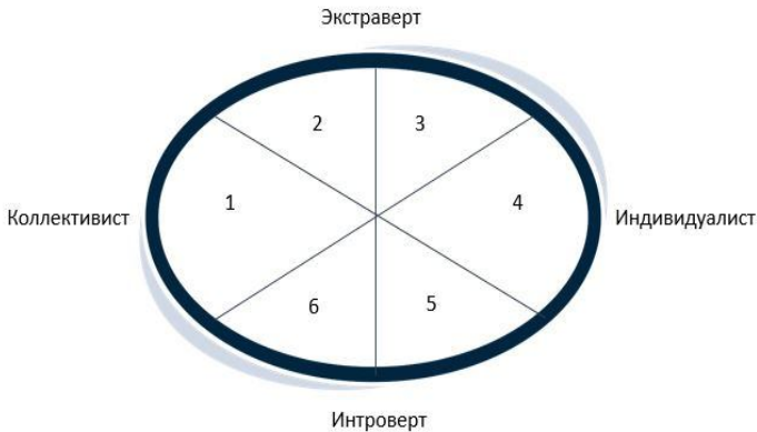
Рис. 2. Типы личности