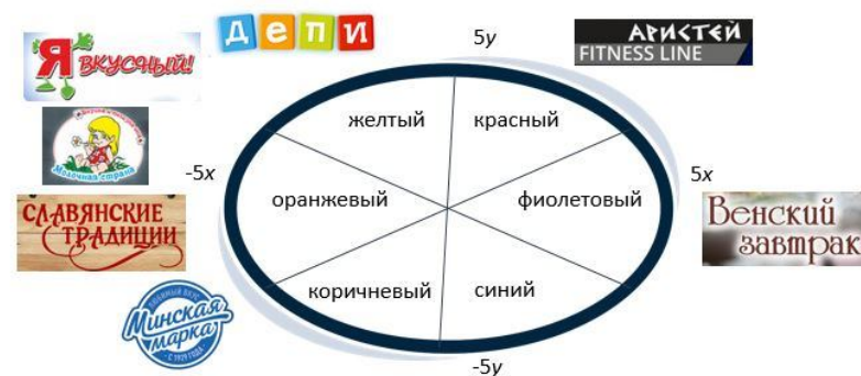
Рис. 6. Модель эмоционального восприятия бренда ОАО «Минский молочный завод № 1»

В данной ситуации позиционирование брендов «Я вкусный» и «Молочная страна» нужно пересмотреть. «Я вкусный», как функциональный йогурт можно перевести в «синий» сегмента, а «Молочная страна», как бренд, заботящийся о потребителе – в коричневый. Данные действия, позволят оптимизировать портфель и всецело охватывать потребности всех потребителей, без вывода новых брендов.