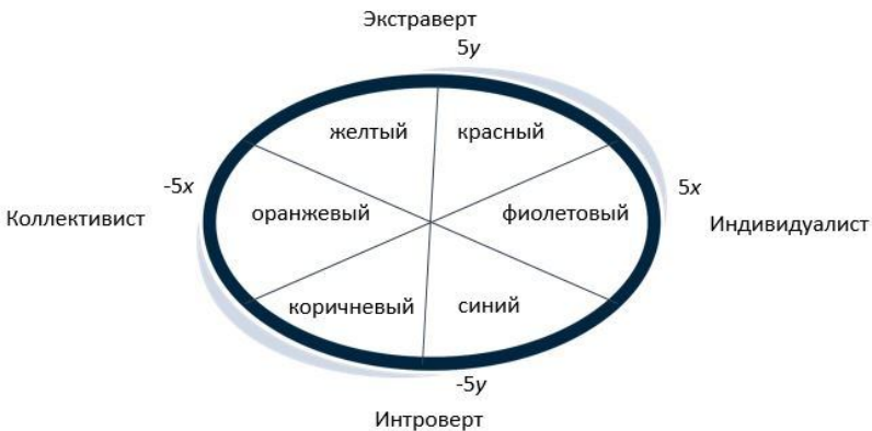
Рис. 3. Модель эмоционального восприятия бренда

Бренды стараются соответствовать той группе людей, потребности которой они удовлетворяют. Таким образом, любой бренд можно отнести к одному из сегментов модели эмоционального восприятия бренда (рисунок 3) [7].