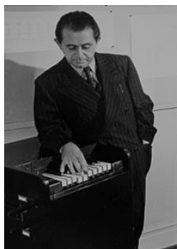
И. М. Шиллингер (1895–1943)

У истоков становления клуба, его успешной деятельности стояли известные деятели искусства, состоявшие в штате преподавателей ХТИ.