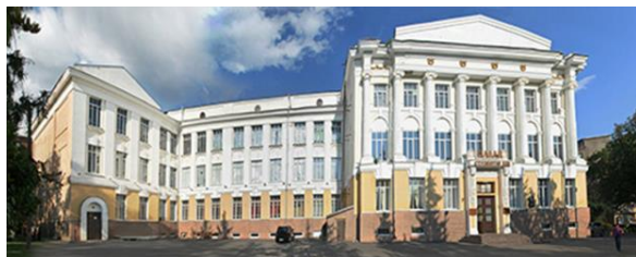
Дворец студентов НТУ «ХПИ»

Изучив архивные материалы по истории университета в преддверие его 130-летнего юбилея можем с уверенностью утверждать, что библиотека, как и весь коллектив НТУ «ХПИ» по-прежнему верна традициям созидания и просвещения.