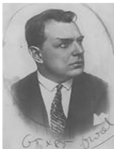
В. В. Бердяев (1885–1956)

первым разработал метод, позволяющий генерировать бесконечное количество ритмических фигур, а также научно анализировать модели прошлого. Это позволило нам проследить происхождение языка и музыки до небывалых степеней» [14].