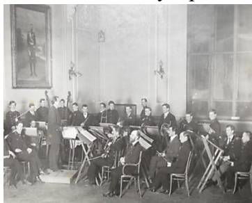
Концерт симфонического оркестра ХТИ