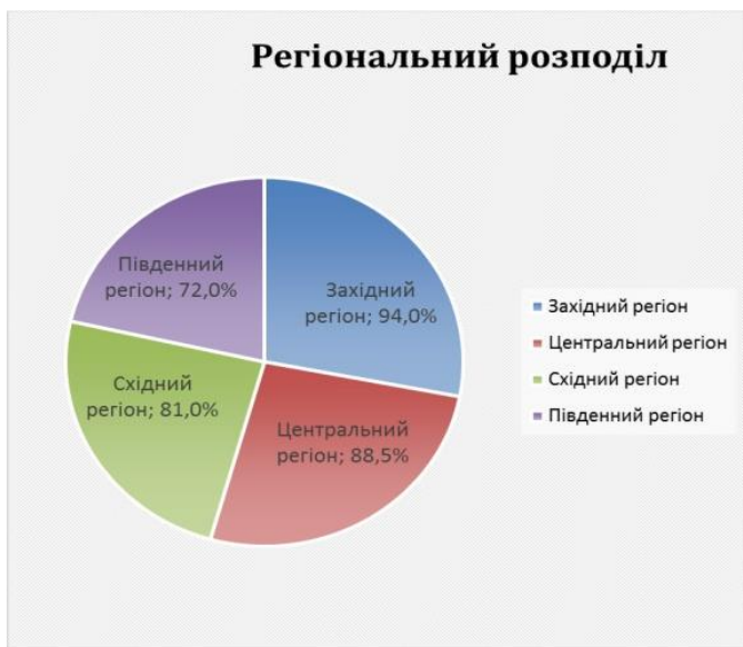
Діаграма 2. Регіональний розподіл рівня патріотизму за даними Центру Разумкова

• І хоча останнім часом рівень патріотизму українського населення зріс, але необхідність у вихованні патріотизму та національної свідомості молоді як основи консолідації суспільства і зміцнення держави залишається досить актуальною.