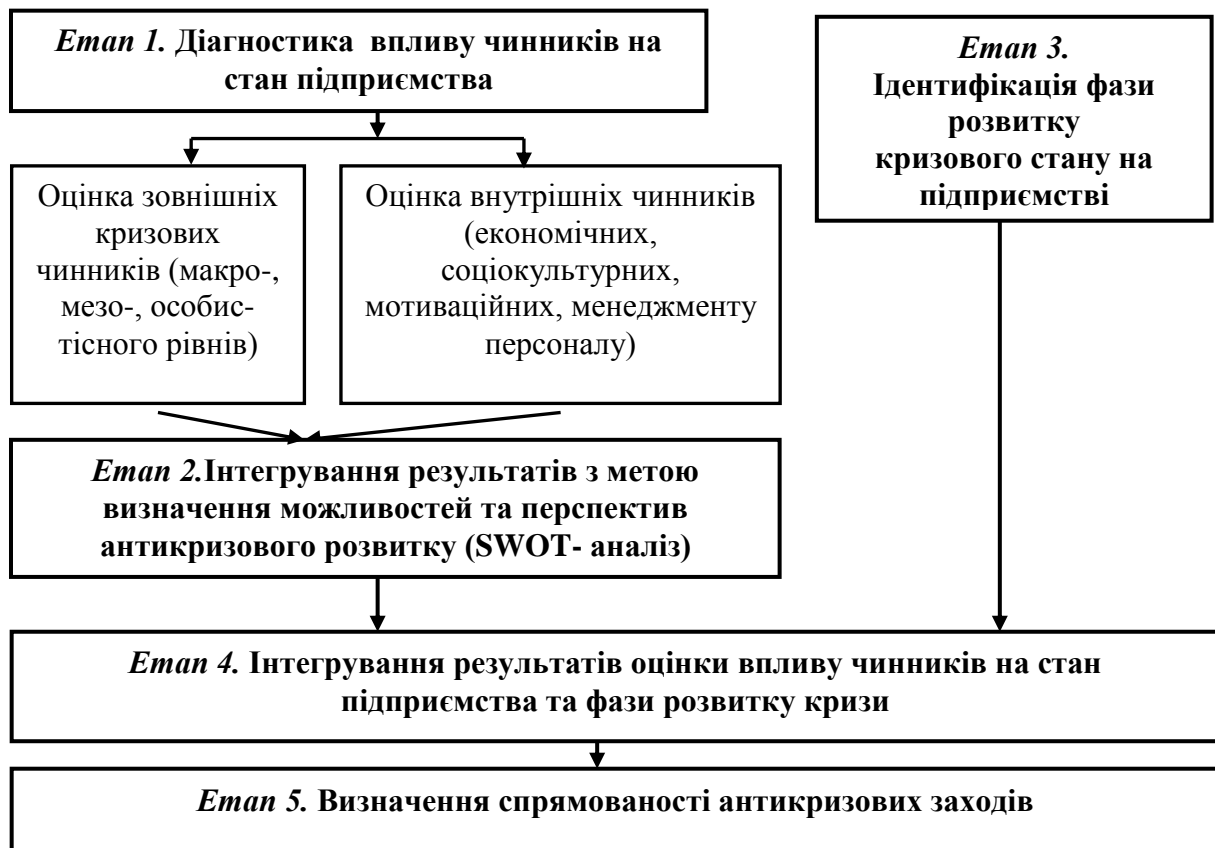
Рис. 2.2. Структурно-логічна схема методичного підходу до діагностики кризового стану підприємств роздрібної торгівлі [27]