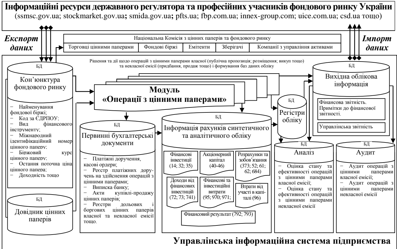
Рис. 3. Інформаційна модель технології обліку операцій з цінними паперами в управлінській інформаційній системі підприємства

У третьому розділі «Аудит операцій підприємства з цінними паперами» обґрунтовано концептуальні положення та розроблено практичні рекомендації з організації аудиту операцій підприємства з цінними паперами задля підтвердження достовірності облікової інформації щодо них; вдосконалено методика внутрішнього аудиту операцій з цінними паперами власної та невлавної емісії; удосконалено методичний інструментарій аналітичних процедур аудиту операцій з цінними паперами.