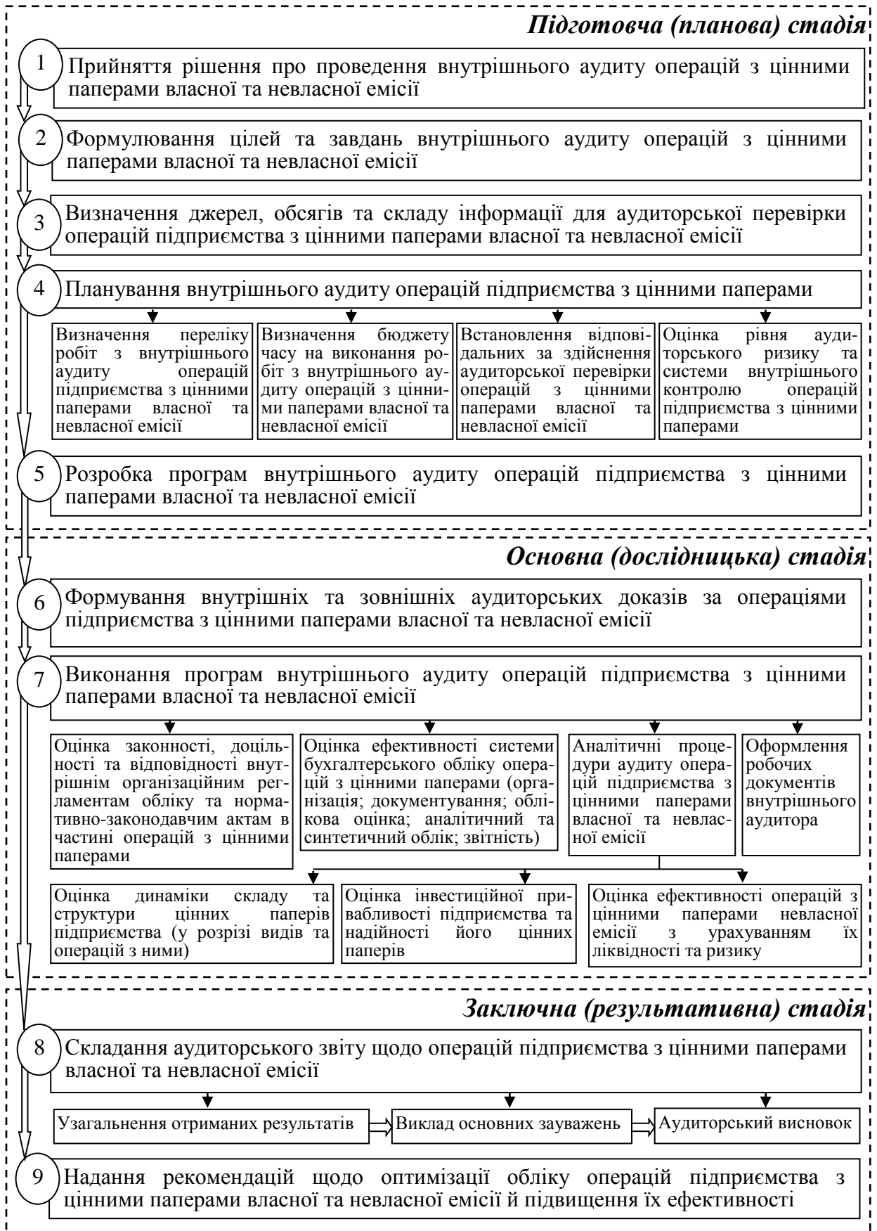
Рис. 4. Функціональна модель внутрішнього аудиту операцій підприємства з цінними паперами