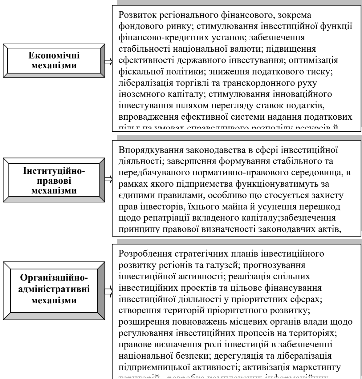
Рис. 2. Механізми покращення інвестиційного клімату в регіонах України на етапі дестабілізації економіки