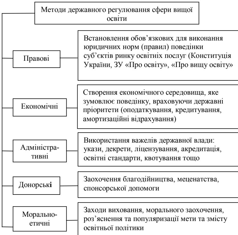
Рис. 2. Методи державного регулювання сфери вищої освіти

власного змісту, що, в свою чергу, вимагає пошуку нових засобів регулювання з боку держави.