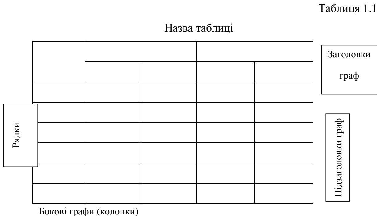
Рис. 2 – структура таблиці

Цифровий матеріал, як правило, слід оформлювати у вигляді таблиць (рис. 2).