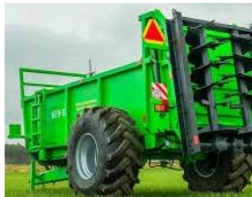
Рис. 4. Розкидач органічних добрив МТУ-10