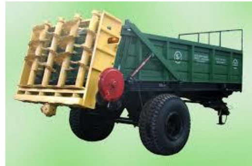
Рис. 2. Розкидач органічних добрив РТД-5