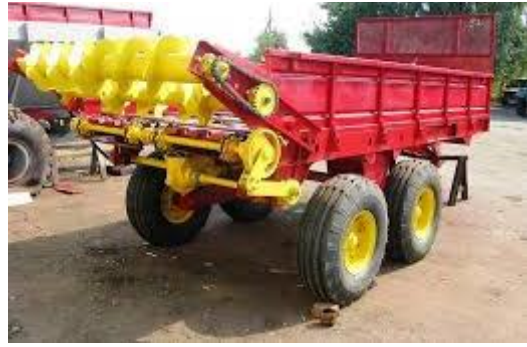
Рис. 1. Розкидач органічних добрив РОУ-6

В машинах типу ПРТ-10 застосована посилена підвісна ходова системи.