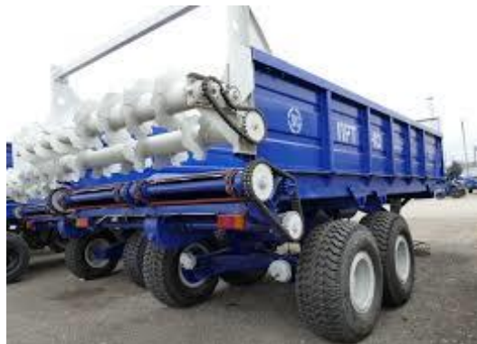
Рис. 3. Розкидач органічних добрив ПРТ-10