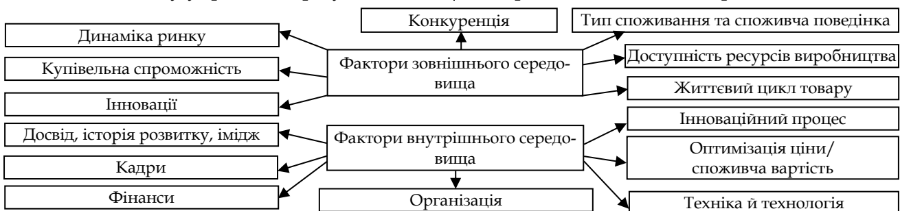
Рис. 2. Зовнішні й внутрішні фактори фінансово-економічної результативності аграрного підприємства

Основні фактори зовнішнього та внутрішнього середовища, які визначають поточні й перспективні значення фінансово-економічної результативності діяльності аграрного підприємства наведені на рис. 2.