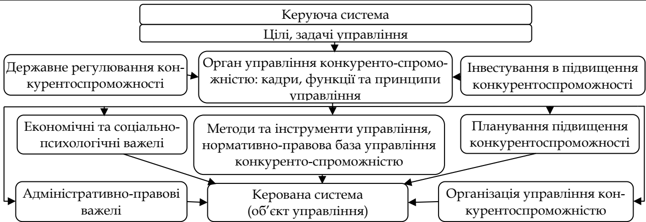
Рис. 1. Схема організаційно-економічного механізму управління конкурентоспроможністю аграрних підприємств

У запропонованому механізмі особливе місце займає нормативно-правова база управління конкурентоспроможністю, яка містить державні, галузеві стандарти, технічні умови та стандарти підприємств. Важливе значення стандартизації в забезпеченні конкурентоспроможності підприємства доведено багатьма вченими [4]. Вагомою є роль стандартів у системах сертифікації агропродовольчої продукції, які значно впливають на підвищення