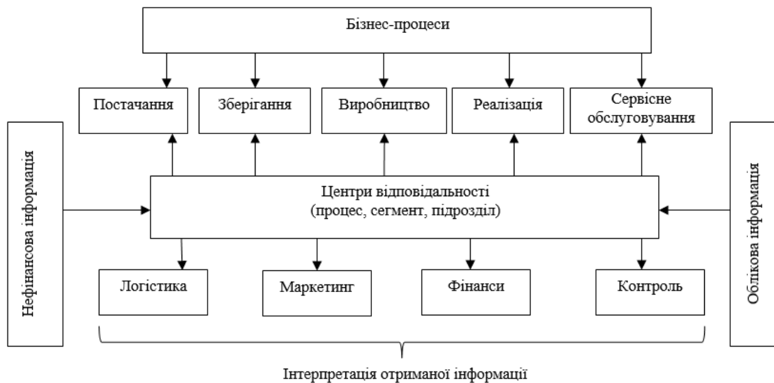
Рис. 2. Організаційна модель інформаційного забезпечення управління діяльністю об'єктами ритейлу

За даною моделлю об'єкти ритейлу зможуть працювати ефективно та результативно за умов створення безпечної та комфортної системи комунікаційних зв'язків, що дозволять обмінюватися необхідними масивами релевантної інформації між центрами відповідальності, з групами стейкхолдерів та державними органами управління в мінливих умовах цифрової економіки. У цьому разі ключовими напрямками трансформації організаційних механізмів вважаються: технологічна автоматизація бізнес-процесів на підприємствах; автоматизація бізнес-комунікацій; глибинний розвиток ІТ-інфраструктури; впровадження системи бюджетування та єдиного електронного документообігу; забезпечення офісів підприємств сучасними ІТ-інструментами та механізмами: новими каналами зв'язку, мережами, центрами обробки даних і серверами; перехід на хмарний серверний простір [8].