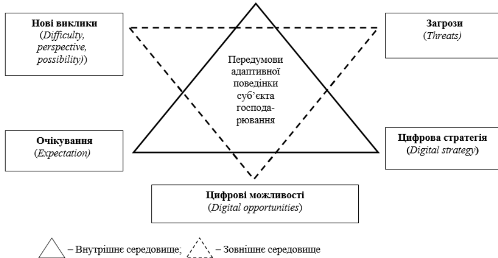
Рис. 1. Внутрішні та зовнішні передумови адаптивної поведінки суб'єкта господарювання

є результатом синергії організаційних, інформаційних, комунікаційних механізмів для прийняття рішень (на рис. 2).