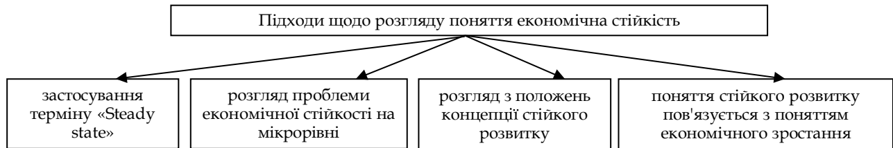
Рис. 3. Підходи щодо розгляду поняття економічна стійкість

часом у технічній сфері воно стало широко вживаним в кінці ХІХ ст., після того як було визначено поняття стійкості й сформульовано теореми про стійкість і нестійкість технічної системи [7]. Можна відокремити чотири основні підходи до розгляду поняття «економічна стійкість», що існують сьогодні в економічній науці (рис. 3).